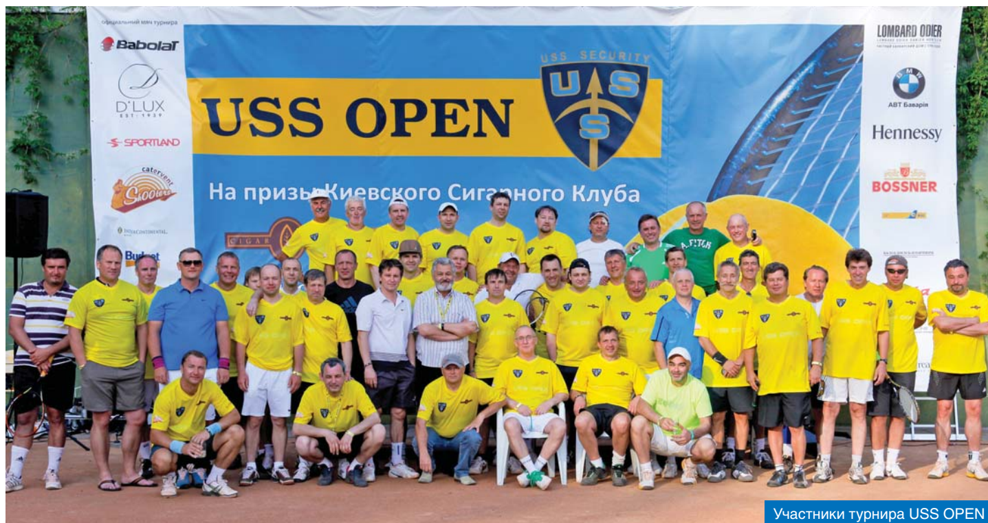
Участники турнира USS OPEN

(охранная компания Сыырумаа осуществляет обеспечение Президента Эстонии и представителей других государственных ведомств; Урмас руководит проектами в области девелопмента, энергетики, клининга...), но для нас важнее всего Его величество Теннис.