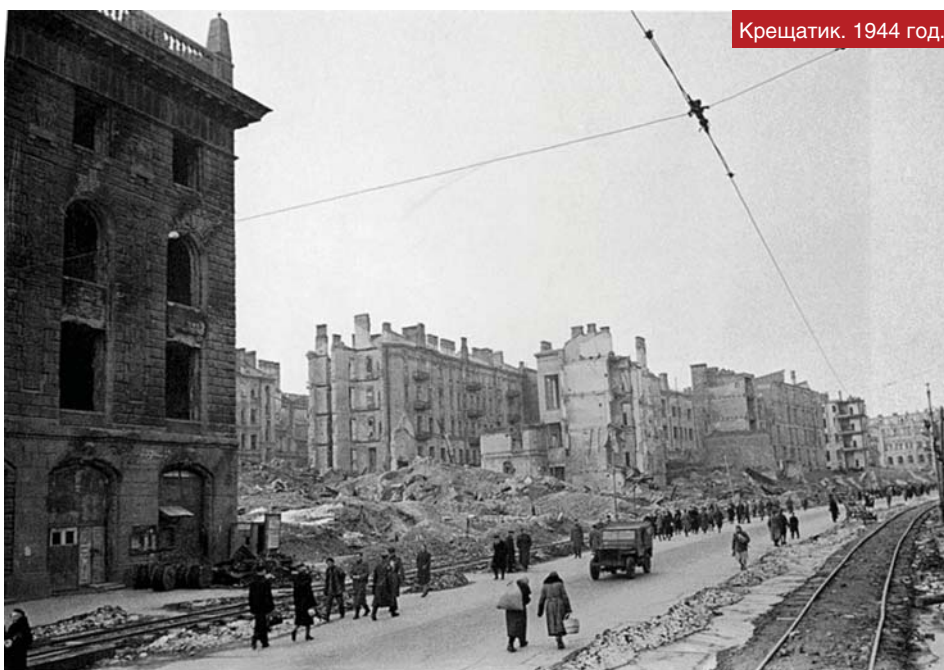
Крещатик. 1944 год.